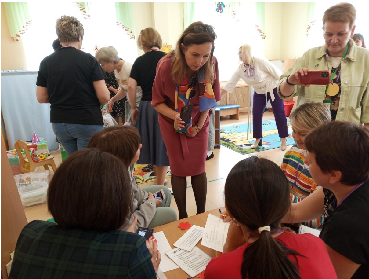
Экспертный семинар в ДОУ №93