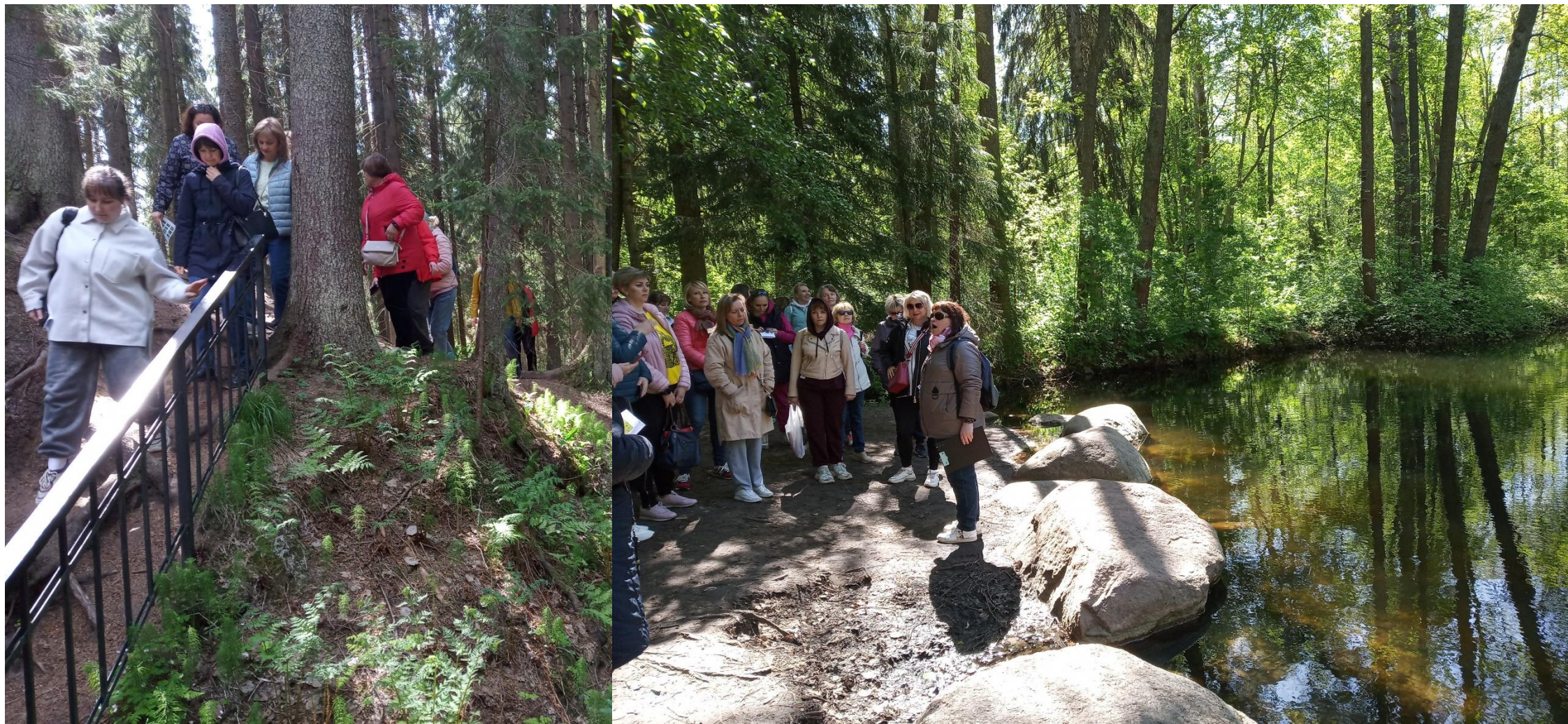
Памятник природы регионального значения «Комаровский берег»