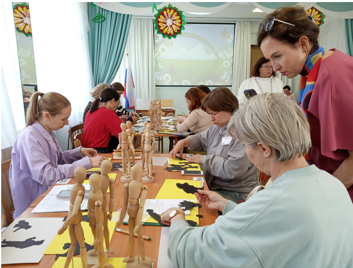
Экспертный семинар в ДОУ №26