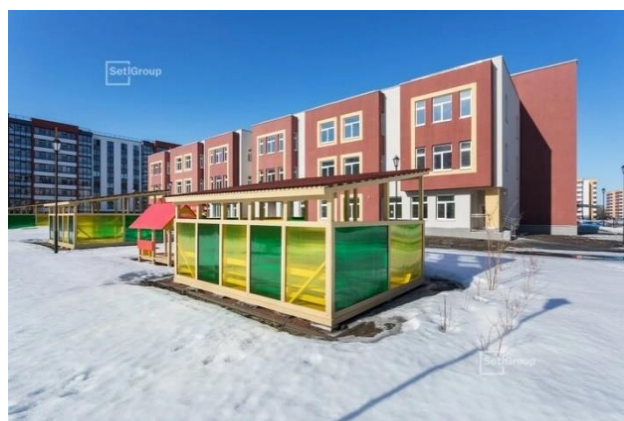
Детский сад № 95, корпус 2