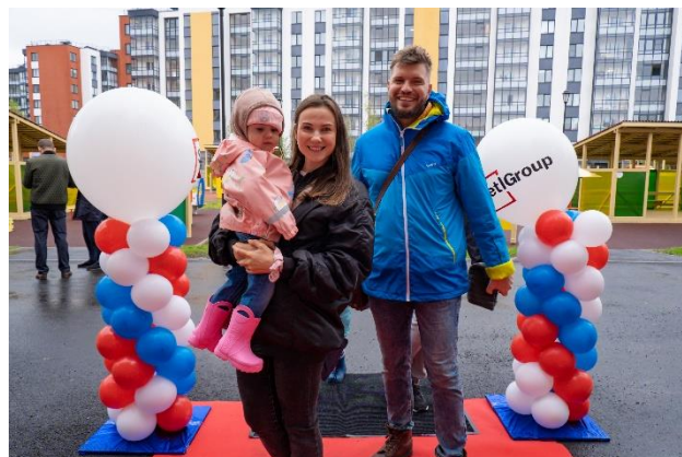
Детский сад № 95, счастливые родители