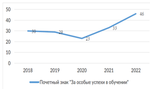
Динамика награждений почетным знаком Правительства Санкт-Петербурга «За особые успехи в обучении» за 5 лет

Радуют высокие достижения учащихся нашего района. Почётным знаком Правительства Санкт-Петербурга «За особые успехи в обучении» отмечено 46 выпускников – это ученики лицея № 369 (11 чел.), гимназии № 271 (6 чел.), школы № 219 (3 чел.), лицея № 395 (3 чел.), школы № 548 (3 чел.), центра образования № 167 (2 чел.), школы № 242 (2 чел.), гимназии № 399 (2 чел.), школы № 509 (2 чел.), школы № 546 (2 чел.), школы № 547 (2 чел.), школы № 276 (1 чел.), школы № 382 (1 чел.), школы № 385 (1 чел.), школы № 394 (1 чел.), гимназии № 505 (1 чел.), международной школы (1 чел.), ШЭИП (1 чел.), ЦОДИВ (1 чел.).