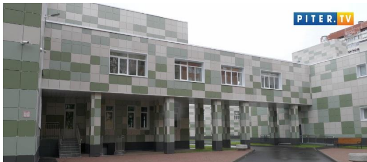
Обновлённое здание лицея № 369

Завершена реконструкция здания лицея № 369. За год строители возвели отдельный корпус. А в период летних каникул его соединили со старым корпусом. Площадь объекта увеличилась на 4 тыс. квадратных метров. Теперь ученикам доступны современные классы труда и информатики, спортивный зал, гончарная мастерская.