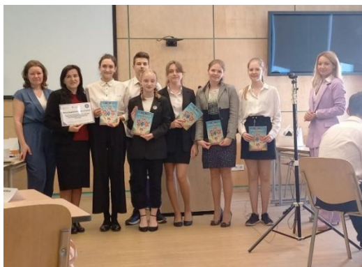
Команда учащихся ГБОУ лицей № 395 – победитель городского Чемпионата по финансовой

Гордимся успехами ребят, участвующих Во Всероссийской олимпиаде школьников. 143 ученика района стали победителями или призёрами на региональном этапе олимпиаде, 7 человек стали призёрами на заключительном этапе олимпиады. И это результат планомерной работы образовательных организаций района по выявлению и психолого-педагогическому сопровождению талантливых и способных учащихся. Среди наиболее результативно работающих с талантливыми школьниками учреждений лицей № 369, гимназия № 271, школа № 548, лицей № 395, школа № 242, а также школы №№ 219, 509, 547, 380, 291.