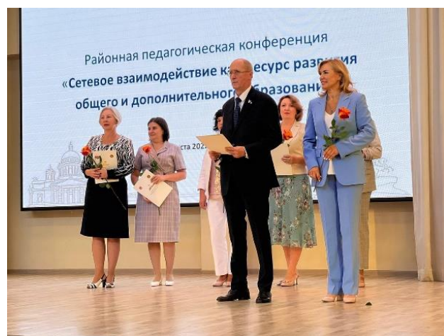
Награждение руководителей образовательных организаций района, 26.08.2022