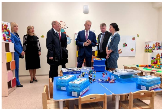
Детский сад № 95, открытие