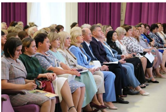
Участники конференции, 22.03.2022

Ежегодно результаты инновационного поиска представляются на научно-практических конференциях, в которых принимают участие работники системы образования нашего района, других районов Санкт-Петербурга и коллеги из других регионов Российской Федерации.