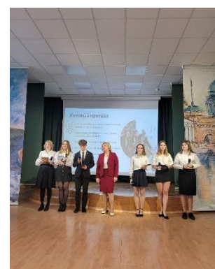
Команда ГБОУ лицей № 395. Проект «АКТовый зал – пространство возможностей»