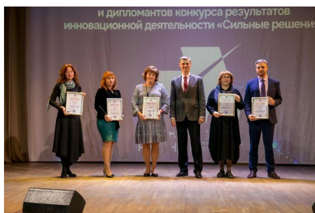
Участники, отмеченные дипломом оргкомитета

Подводя итоги года, можно с уверенностью сказать, что система образования Красносельского района Санкт-Петербурга – открытая, растущая, динамично развивающаяся, социально ориентированная подсистема Петербургской Школы.