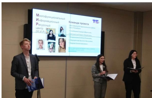
Команда ГБОУ СОШ № 237. Проект «Многофункциональный информационный ресурсный Центр (М.И.Р.)»

Идут в ногу со временем и ученические команды, активно участвуя в проекте школьного инициативного бюджетирования «Твой бюджет в школах», реализуемом Комитетом финансов Санкт-Петербурга совместно с Комитетом по образованию. В 2022 году среди победителей команда учащихся школы № 237, которая при сопровождении мудрых наставников разработала проект «Многофункциональный ресурсный Центр (М.И.Р.)», и команда лицея № 395, которая со своими наставниками разработала проект «АКТовый зал – пространство возможностей». Проект «Твой Бюджет в школах» – это возможность для старшеклассников участвовать в управлении бюджетом школы и