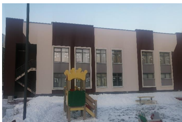
Детский сад № 53, корпус 3

9 декабря 2022 года введено в эксплуатацию третье здание детского сада № 53 на 95 мест, в котором создана доступная среда для воспитанников с ОВЗ, пищеблоку оснащены современным кухонным оборудованием, для воспитанников приобретена интерактивная панель и современное игровое оборудование.