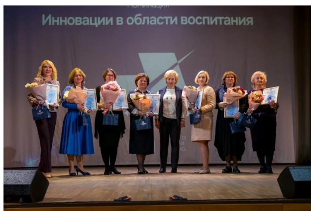
Победители и призёры в номинации «Инновации в области воспитания»