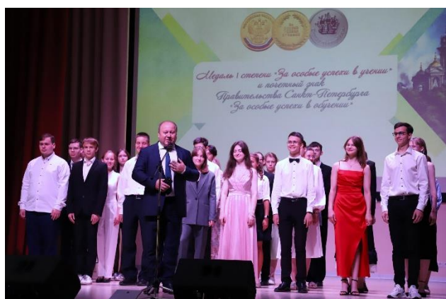
Медалисты 2024 года

За последние 5 лет отмечается положительная динамика количества медалистов в Красносельском районе. По итогам 2024 года награждено медалью «За особые успехи в учении» 1 степени 255 выпускников, медалью «За особые успехи в учении» 2 степени – 138 выпускников. Это результат совместной работы обучающихся и педагогов общеобразовательных учреждений. Знака Правительства Санкт-Петербурга «За особые успехи в обучении» удостоены 63 человека. По количеству знаков Красносельский район на третьем месте в городе.