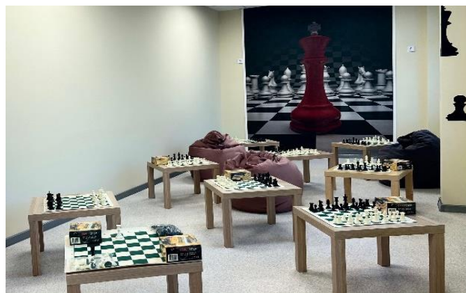
Лицей № 369. Шахматная студия

17 сентября 2024 года во втором здании школы № 385 состоялось торжественное открытие центра цифрового образования «ИнфинТИ», созданного в ходе реализации регионального и федерального проектов «Цифровая образовательная среда». В центре оборудованы зона коллективной работы, шахматная гостиная, кабинеты для реализации направлений «Программирование роботов», «Разработка VR/AR-приложений», «Мобильная разработка», «Кибергигиена и работа с большими данными», «Основы алгоритмики и логики», «Программирование на Python». Уже сейчас в центре реализуется 10 дополнительных образовательных программ для 210 обучающихся.