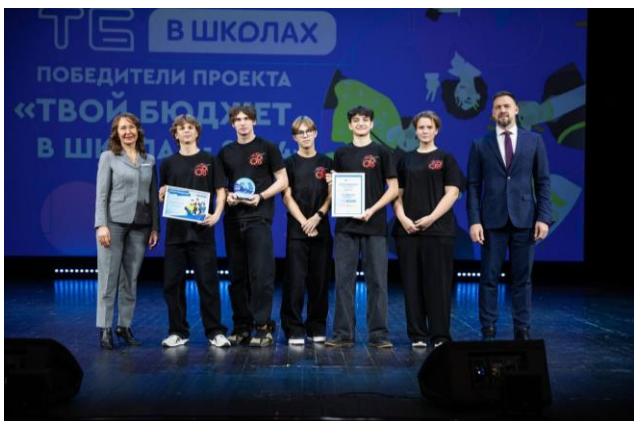
Команда школы № 54