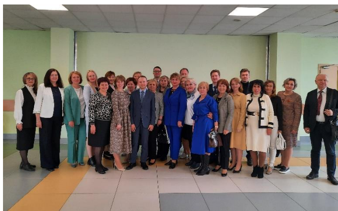
Участники стратегической сессии «Школа Минпросвещения России»: задачи для руководителя школы»

В районе выстроена инновационная инфраструктура, в которую вовлечено 36,4 % от общего количества образовательных организаций района. Работают федеральные и региональные инновационные площадки, опытно-экспериментальные площадки научных организаций федерального уровня, центры инновационного педагогического поиска. Инновационные практики представлены на 7 научно-практических конференциях, организуемых Информационно-методическим центром. В течение 2024 года инновационные педагогические практики представили инновационные команды 27 дошкольных образовательных организаций (№№ 4, 12, 22, 26, 29, 30, 35, 38, 48, 53, 54, 56, 61, 67, 69, 72, 76, 78, 82, 87, 88, 91, 92, 93, 94, 95, 96) и 28 школ района (№№ 7, 54, 167, 200, 203, 237, 247, 271, 289, 291, 293, 375, 382, 385, 394, 395, 399, 505, 509, 546, 547, 549, 568, 590, 675, 678, Лицей искусств, Школа экономики и права), а также ЦПМСС, ДДТ, ЦППВиБЖ и ИМЦ.