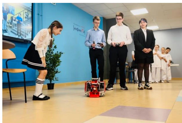
Школа № 385 (2 здание, пр. Ветеранов, д.173, к.4) Ученики знакомятся с новыми возможностями

Проект школьного инициативного бюджетирования «Твой бюджет в школах», реализуемый Комитетом финансов Санкт-Петербурга совместно с Комитетом по образованию, является ещё одной возможностью развития школьной инфраструктуры. В этом проекте свой вклад в трансформацию школьных пространств вносят проектные команды старшеклассников. В этом году победителями проекта стали сразу две команды из нашего района. Проект «Авиаторы будущего» 9-го «РЖД» класса школы № 54 занял 3 место. Созданное школьное пространство позволит всем желающим освоить управление дронами с использованием информационных технологий и виртуальной реальности. Одержала победу и команда «За нами будущее», в составе которой ученики 10 «А» класса школы № 200. Ребята успешно защитили свой проект «Найди себя», результатом реализации которого станет новое пространство для профориентации с использованием очков виртуальной реальности и специального программного обеспечения.