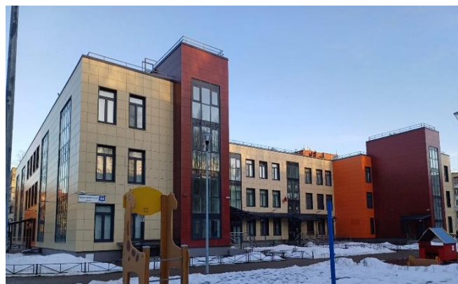
Дошкольное отделение школы № 391. Красносельское шоссе, д.44, корп.2, строение 1

В преддверии нового учебного года 30 августа открылся четвёртый корпус детского сада № 95 «Подсолнух», рассчитанный на 220 воспитанников. Начал работу детский сад № 97 «Планета детства» на 420 воспитанников – одно из крупнейших дошкольных образовательных учреждений Санкт-Петербурга.