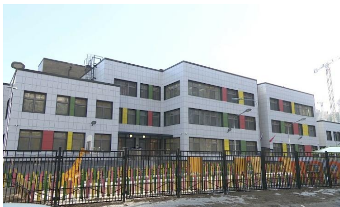
Детский сад № 91. Третий корпус. Ленинский проспект, дом 64 корпус 2, строение 1

А 29 марта распахнул двери третий корпус детского сада № 90 на проспекте Патриотов. Образовательное учреждение рассчитано на 190 детей – это 8 групп, из них две – для малышей.