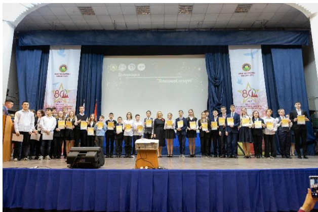
Победители и призёры районного этапа Всероссийской олимпиады школьников. Номинация «Успешный старт»