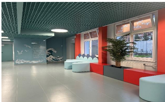
Лицей № 369. Обновлённая рекреация «Стихия воздуха»

увлекательного путешествия в страну знаний. Уникальный проект, реализованный в лицее № 369, даёт старт модернизации старых школьных зданий.