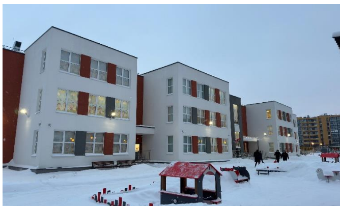
Детский сад № 95. Третий корпус. Проспект Будённого 21, корп. 2, стр. 1

19 января 2024 года торжественно открылся третий корпус детского сада № 95 «Подсолнух» на 220 воспитанников (4 группы раннего и 8 групп дошкольного возраста).