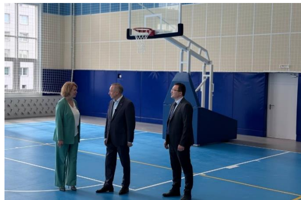
Школа № 509, второй корпус. Визит Губернатора А.Д. Беглова

Второй корпус школы № 509 в ЖК «Огни залива» и второй корпус школы № 548 в ЖК «Морская миля». Оба новых корпуса рассчитаны на 825 мест. В них имеются физкультурные залы и бассейны, просторный актовый зал с эстрадой, библиотека с читальным залом и зоной коворкинга, специализированные кабинеты физики, химии, биологии, информатики, мастерские для уроков труда, лингафонные кабинеты. На пришкольной территории обустроено многофункциональное спортивное ядро.