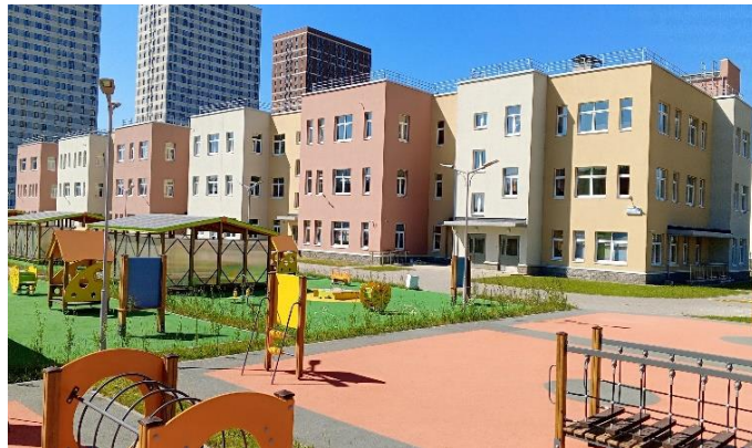
Детский сад № 97 «Планета детства». Улица Морской Пехоты, дом 24, корп. 2, стр. 1

Все открытые в 2024 году здания дошкольных образовательных организаций оснащены по Петербургскому стандарту. Уютные групповые помещения и спальни, музыкальный зал, кабинеты для работы кружков и внегрупповые пространства создают возможности для счастливого детства. Обустроенные по требованиям СанПиН пищеблоки, спортивные залы, прогулочные и спортивные площадки, кабинеты песочной терапии и скалодром позволят сохранить и укрепить здоровье воспитанников. Уникальное современное оборудование для занятий пространственным моделированием и робототехникой помогут развивать интеллектуальный и творческий потенциал детей дошкольного возраста.