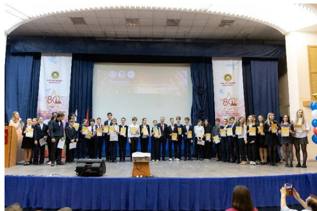
Победители и призёры районного этапа Всероссийской олимпиады школьников. Номинация «Инновационный прорыв»

В региональном этапе приняли участие 374 ученика. По количеству участия в регионе район занимает 4 место среди 18 районов Санкт-Петербурга. По результативности участия Красносельский район тоже на четвертом месте: 145 призёров и 20 победителей. 17 старшеклассников приняли участие в заключительном этапе олимпиады: двое стали победителями, 11 – призёрами.