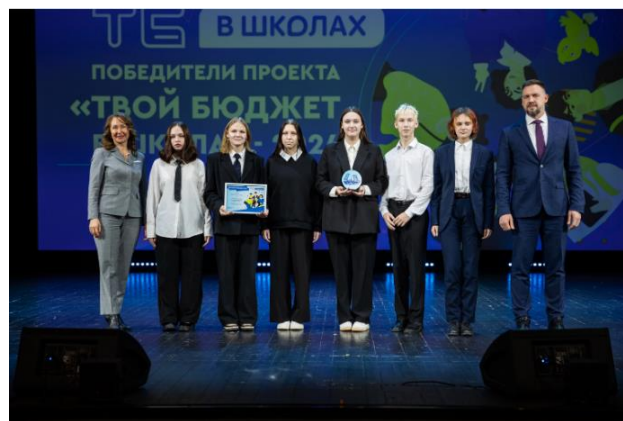
Команда школы № 200

Чем ещё запомнится год 2024 в системе образования района? Представляем наиболее яркие достижения районной системы образования.