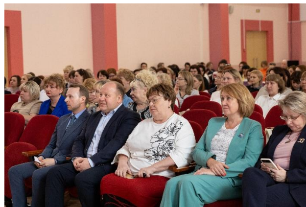
Участники научно-практической конференции «Инновационные процессы в системе образования Красносельского района Санкт-Петербурга», 03.05.2024