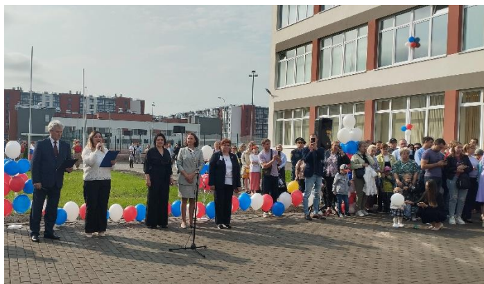
Центр образования № 167. Церемония открытия

Новое здание в ЖК «Солнечный город» получил Центр образования № 167. Здание рассчитано на 1375 мест. Оно также оснащено в соответствии с Петербургским стандартом: современное оборудование в предметных кабинетах, спортивные залы и площадки, бассейны и уникальное оборудование для занятий по обучению плаванию на каякинге создают необходимые условия для получения качественного образования.