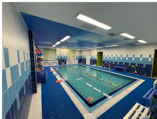
Детский сад № 95. Третий корпус. Бассейн

13 марта двери для малышей открыли сразу два новых детских сада. Третий корпус детского сада № 91 на Ленинском проспекте рассчитан на 180 воспитанников (2 группы раннего развития и 6 групп дошкольного возраста). Дошкольное отделение школы № 391 в муниципальном округе Горелово рассчитано на 220 детей (12 групп от полутора до восьми лет).