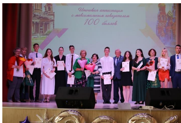
Стобалльники 2024 года

Высокий уровень качества образования демонстрируют выпускники 2024 года. 29 выпускников получили высший результат в ходе Единого государственного экзамена. Из них 100 баллов по русскому языку получили 9 выпускников из школ №№ 219, 270, 293, 382, 547, 548, Лицея искусств и ЧШ «ЦОДИВ», по литературе – 9 выпускников из школ №№ 167, 291, 369, 394, 505, 548 и ЧШ «ЦОДИВ», по химии – 6 выпускников из школ 291, 369, 399, по математике – 3 выпускника из школ №№ 54, 395, 590, по физике – 2 человека из школ №№ 217, 252. Четыре выпускника получили 200 баллов, из них два – из лицея № 369, по одному из школ №№ 237, 548.