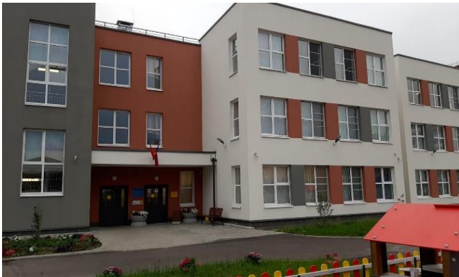
Детский сад № 95. Четвёртый корпус. Проспект Буденного, д.23, стр. 7